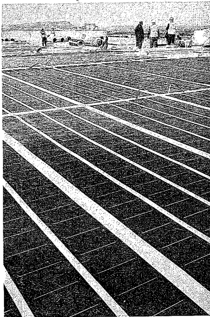
Paneles solares sobre unos almacenes de Laudun-Lardoise, Francia.

Marco legal La regulación favorable que prima la producción eléctrica procedente de fuentes renovables, como la eólica y la fotovoltaica, está fomentando esta tendencia. Si bien, la menor disponibilidad de crédito, por las restricciones de liquidez de las entidades financieras, supone cierta barrera.